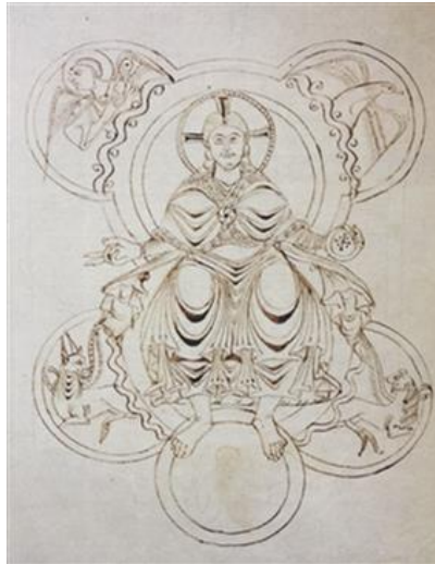
Abb. 5: Federzeichnung der Maiestas Domini als Abbild des Aachener Kuppelmosaiks, Zürich, Zentralbibliothek, Ms. C80, 3. Viertel des 9. Jahrhunderts, aus Tresp und Schmuki, Hrsg., Alkuin von York und die geistige Grundlegung Europas , 258.

Wissenszwergen zu werden bzw. unsere Weltbilder durch Bilderwelten zu ersetzen.