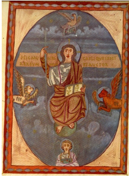
Abb. 2: Majestas Domini, Tournoner Evangeliar, entstanden unter Abt Fridugis um 830, im St. Martinskloster in Tours (heute: Stuttgart LB II, 40), aus Fischer, Die Alkuin Bibel , 10–1.