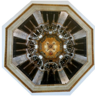
Abb. 4: Blick in das im 19. Jahrhundert nachgestaltete Mosaik des Kuppelgewölbes des Aachener Doms. Mosaik des Kuppelgewölbes, aus Harald Müller, Clemens M. M. Bayer und Max Kerner, Hrsg. Die Aachener Marienkirche: Aspekte ihrer Archäologie und frühen Geschichte ; Harald Müller, Clemens M. M. Bayer und Max Kerner, Der Aachener Dom in seiner Geschichte, Quellen und Forschungen 1, 99 (Regensburg: Schnell und Steiner, 2014).